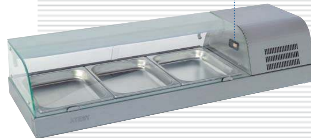
суши-кейс, вид сзади sushi case, rear view

The models being produced are designed to accommodate three or four gastronorm containers GN 1/2×40.