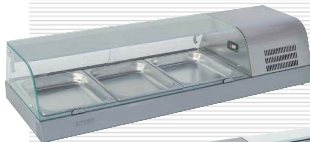
холодильная витрина, вид сзади refrigerating display cabinet, rear view