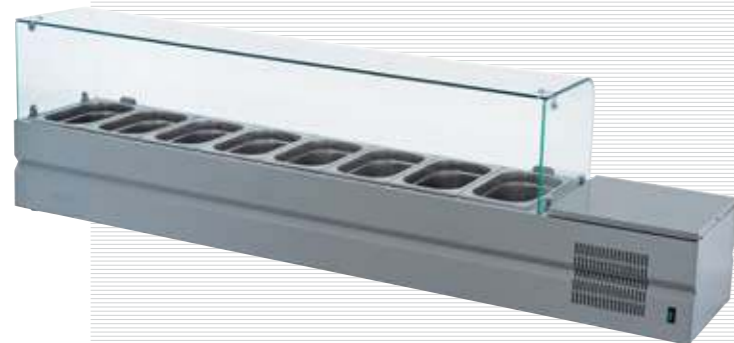
Болоньезе-8, вид сзади Bolognese-8, rear view