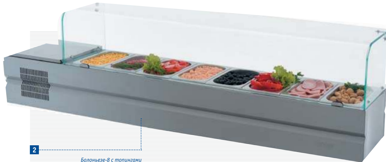
2 Болоньезе-8 с топингами Bolognese-8 with toppings