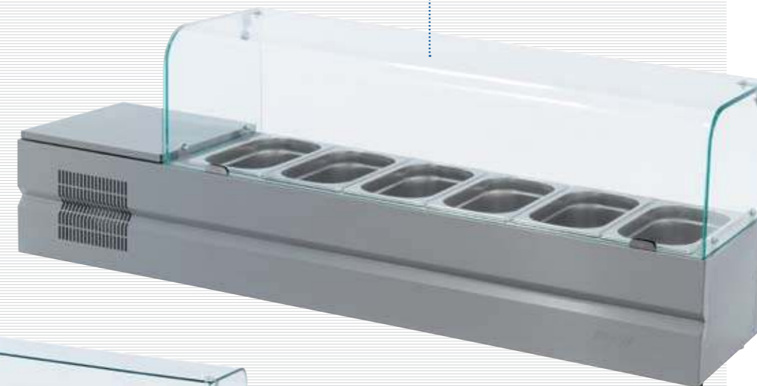
Болоньезе-6, вид спереди Bolognese-6, front view