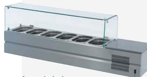
Болоньезе-6, вид сзади Bolognese-6, rear view