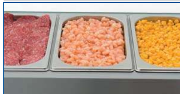
Болоньезе-6 с топингами Bolognese-6 with toppings

Для дополнительного удобства витрины снабжены выносным дополнительным столиком размером 300×300мм.