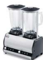
Orione 2T VV