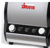
Orione Plus VV