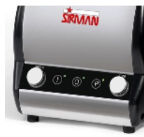
Orione Timer VV