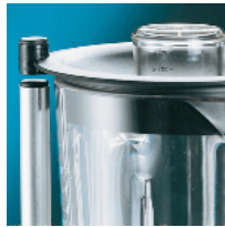
Microswitch on cover