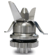
Removable assembly - Saturno X