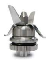
Removable s/steel knives assembly