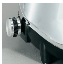
Variable speed device optional